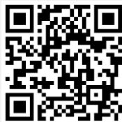
คู่มือการใช้งาน e-Request